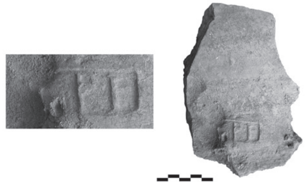
Обр. 2. Conbustica. Находки от ранноримския пласт. Обр. 3. Conbustica. Фрагмент от тухла с печат на Leg(ionis) VII C(laudiae) p(iae) f(idelis) .

36-37, Т. 55-56). Сред находките от Conbustica част от тази керамика е покрита с черен лак (обр. 2/10, 15 – 17).